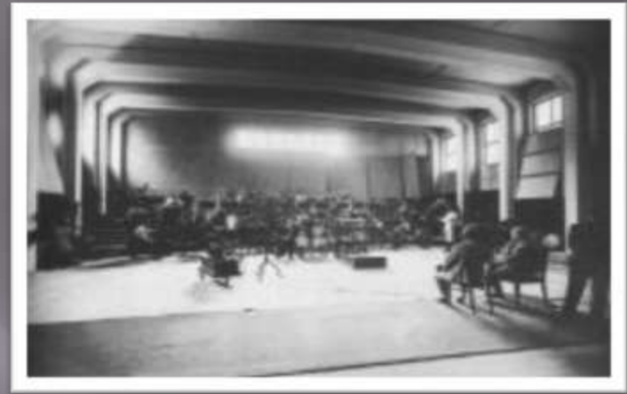
A VI-os stúdió az akusztikai beállítás kísérletekor (1948)