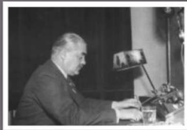
Kozma Miklós, a Rádió elnöke (1941)